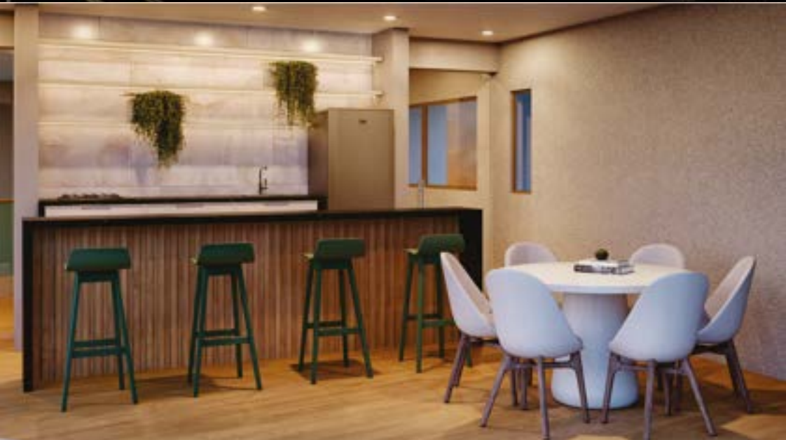
SALÃO GOURMET ◆