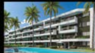
Galápagos Carneiros 100% vendido