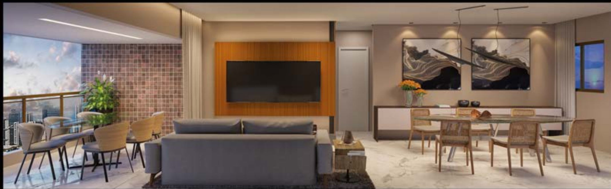
◆ SALA DE ESTAR E JANTAR