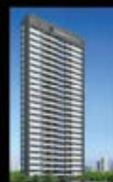
Praça das Auroras Torre Últimas unidades