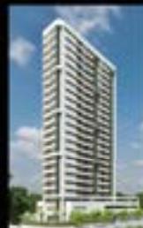
Palácio Rosarinho Encruzilhada Lançamento