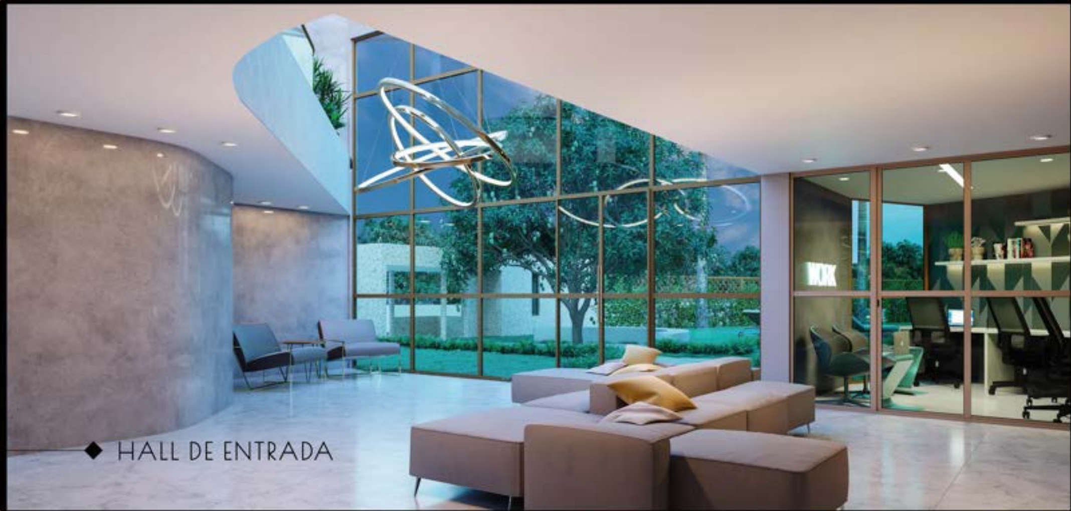
◆ HALL DE ENTRADA