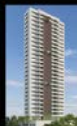
Praça das Seringueiras Cidade Universitária 100% vendido