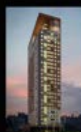
Palácio Boa Vista Boa Vista Lançamento