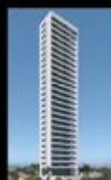
Praça das Hortênsias Torre Últimas unidades