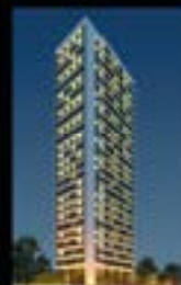
Praça dos Jacarandás Várzea 100% vendido

Experiência, projetos diferenciados, atendimento eficaz e solidez financeira. Tudo isso à serviço do empreendimento que vai fazer você reinventar o seu estilo de vida.